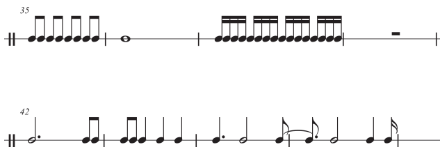
Abbildung 1.24: Übung 7

haben wir alles eingebaut, was Sie bislang können sollten (wobei am wichtigsten die vier Hauptnotenwerte sind). Beginnen Sie ganz langsam, danach können Sie sich steigern.